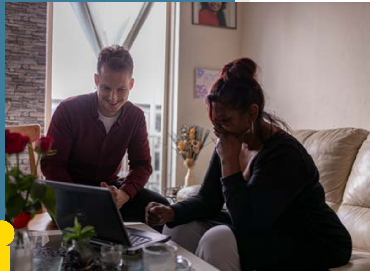
Doelen per leefveld